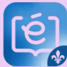
icône de l'application mobile Clic école

La marche à suivre pour créer votre compte, si ce n'est pas déjà fait, sera placée en pièce jointe.